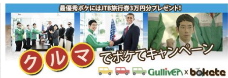
クルマでボケて (ガリバーインターナショナル様)