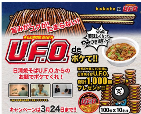
日清焼そばU.F.O.でボケて (日清食品様)

さらに、生成されたコンテンツを二次的に活用することも可能（有料オプション）で、公式サイト、会員コミュニティ、各種ソーシャルメディアアカウント等のオウンドメディアを始めとして、広告制作物、その他プロモーションにおいて、オンラインオフラインを問わず、ご利用いただけます。秀逸なボケによって魅力を纏った画像を応用することで、愛されるブランド接点を作り出すことが可能になります。