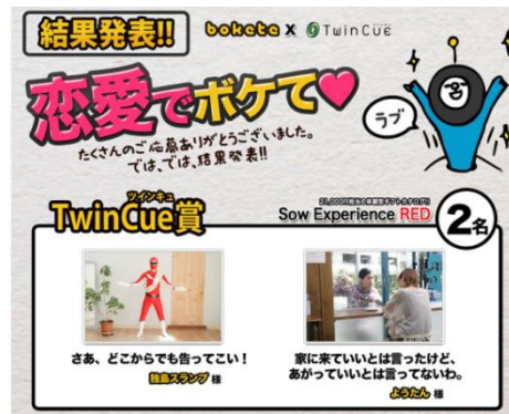
恋愛でボケて (リクルートマーケティングパートナーズ様)